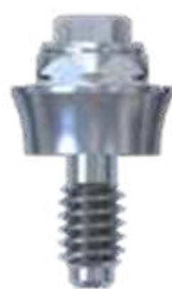
MICRO UNIT RETO