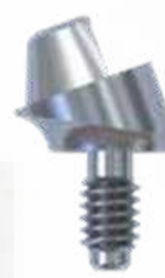
MICRO UNIT ANGULADO 17° E 30

17° - Alturas 4 mm 3 mm 2 mm 30° - Alturas 5 mm 4 mm 3 mm