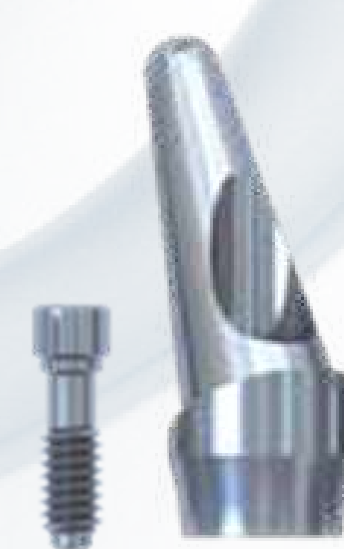
MUNHÃO ANGULADO 15° E 25°