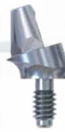
ESTHETICONE ANGULADO 17° E 30

17° - Alturas 4 mm 3 mm 2 mm 30° - Alturas 5 mm 4 mm 3 mm