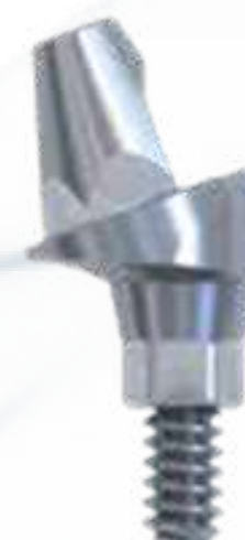
ESTHETICONE ANGULADO 17° E 30°

17° - Alturas 4 mm 3 mm 2 mm 30° - Alturas 5 mm 4 mm 3 mm