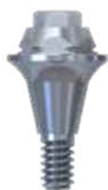
MICRO UNIT RETO