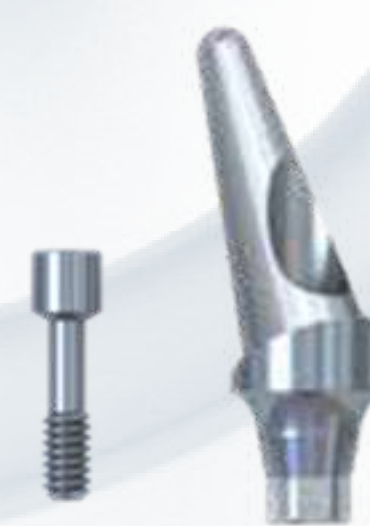
MUNHÃO ANGULADO 15° E 25°