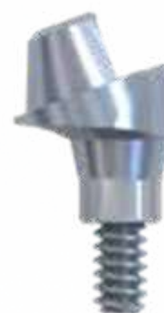
MICRO UNIT ANGULADO 17° E 30°

17° - Alturas 4 mm 3 mm 2 mm 30° - Alturas 5 mm 4 mm 3 mm